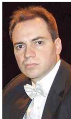
Massimo Folliero actuarà aquesta tarda a la Casa de Cultura de Girona

El festival Art i Altruisme es tancarà diumenge al Teatre Municipal de Girona, amb la sarsuela Cançó