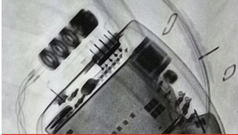
Imatge radiològica del desfibril·lador implantat

Fins ara, aquest tipus d'intervencions requerien el trasllat a Barcelona