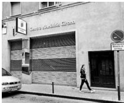
El Centre d'Anàlisis Girona.

Des de llavors és impossible aparcar-hi i les voreres absorbeixen amb dificultats els vianants, els ostentosos cotxets dels immigrants, les cadires de rodes, els coixos i els que llegeixen preocupats