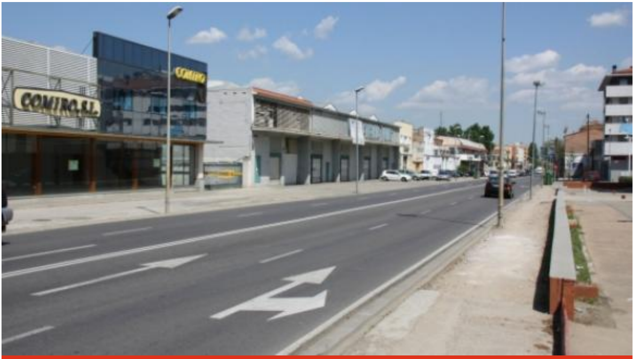
La clínica anirà ubicada a la zona sud de Girona

El govern municipal defensa que és bo que l'equipament es quedi a la ciutat