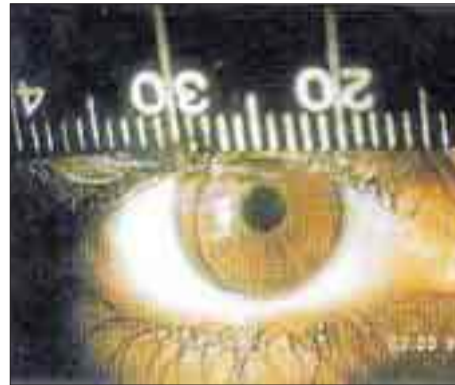
Mesures oculars per escollir la lent de contacte més adequada.