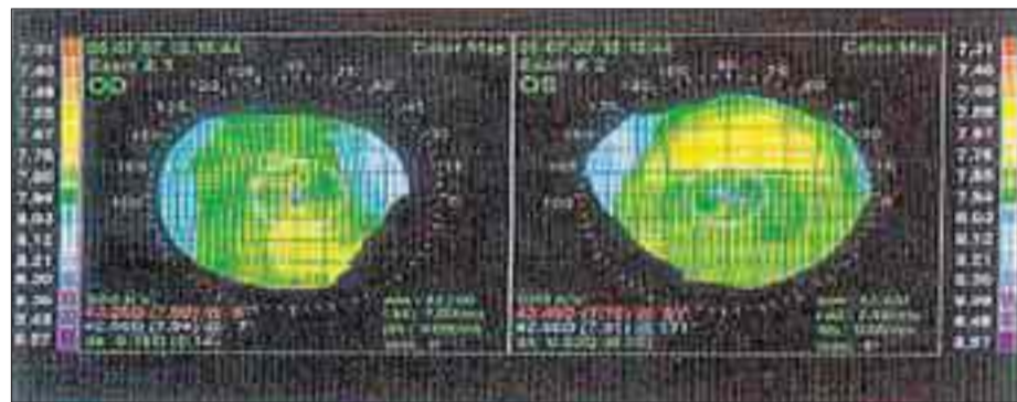
Mapa topogràfic que mostra una distorsió corneal per una mala adaptació de lent rígida gas permeable.