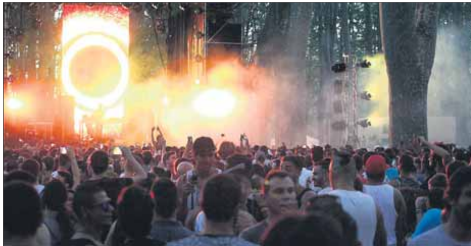
El festival de música 'techno' Escape in the Park és una de les activitats criticades

Asseguren que els usos més perjudicials per a la Devesa són aquells que comporten una "nombrosa presència de persones, l'entrada de vehicles o la instal·lació d'estructures pesants que causen la com-