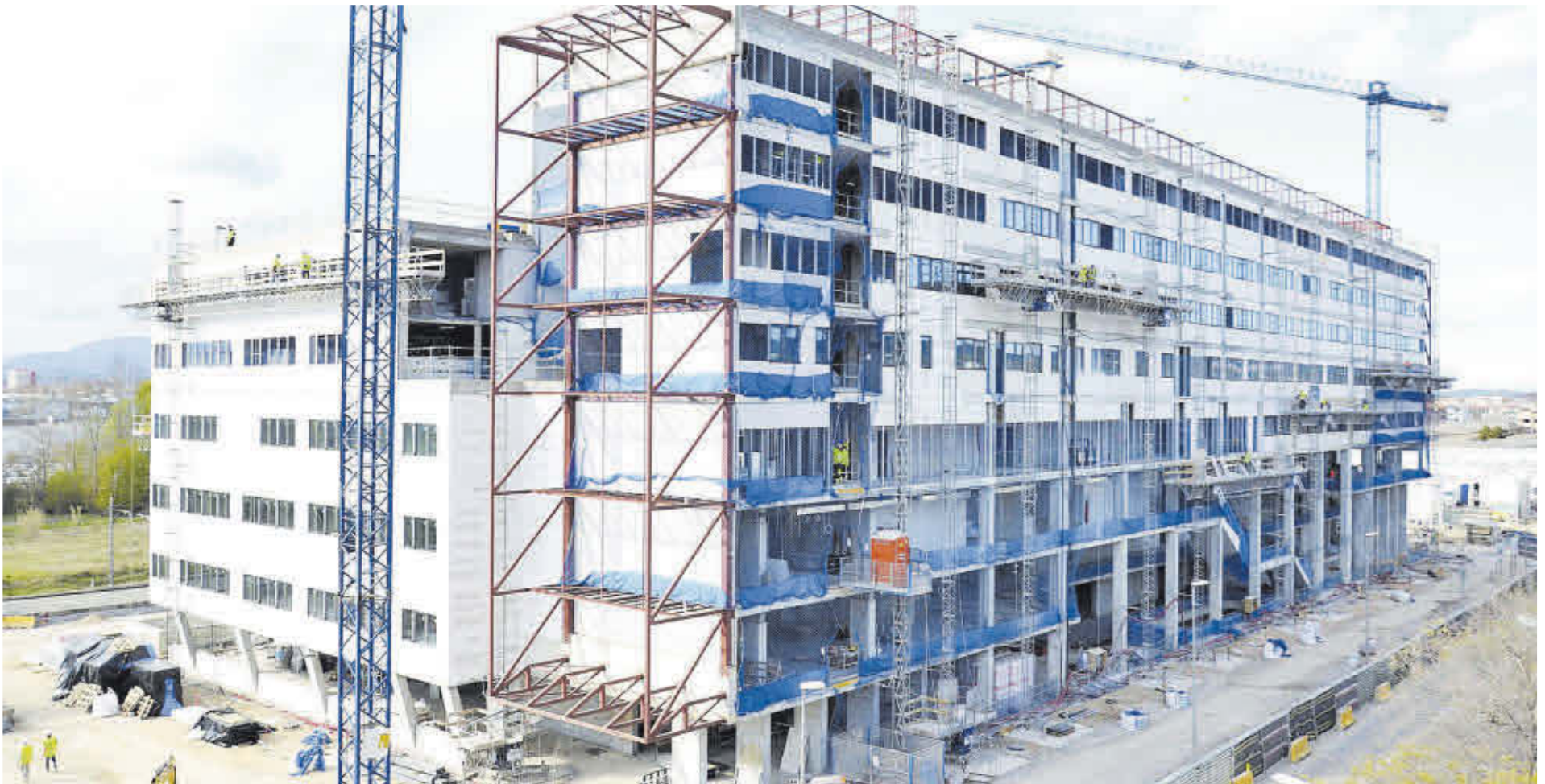
Imatge del nou edifici de Clínica Girona que s'està aixecant a l'entrada sud de la ciutat i que ja es troba a la seva última fase.