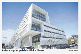
La façana principal de la Clínica Girona. Marc Martí

des en la categoria d'Innovació en la Construcció en la XIX edició dels Premis Catalunya Construcció. Es va valorar la sensibilitat envers l'usuari dels serveis hospitalaris i molt especialment pel que fa als conceptes d'accessibilitat de les persones amb dificultats sensorials i de mobilitat.