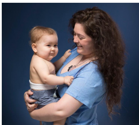
Ale, nen transplantat de cor